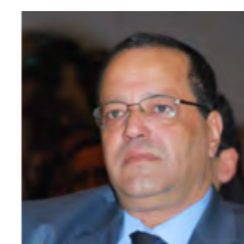
Rhmani Jamal Consultant et Ancien Ministre de l'Emploi et la Formation professionnelle