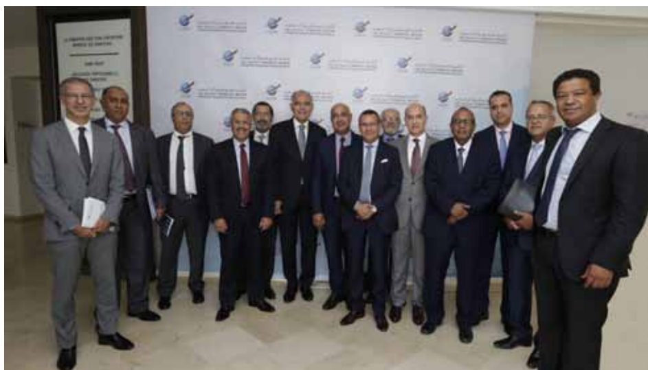
Réunion de concertation du Président de la CGEM avec les Présidents des CGEM Régions le 24/09/2018