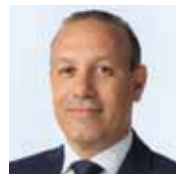
Tarafa Marouane Dynamique sectorielle