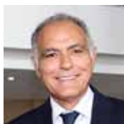
Salaheddine Mezouar Président

Pour décliner le plan d'action de la Présidence, 7 Vice-présidents ont été chargés de mettre en application les axes spécifiques suivants :