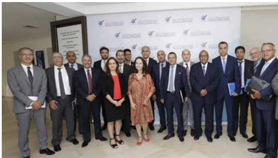
Bureau de la CGEM avec les Présidents des CGEM Régions en marge du CA du 24/09/2018